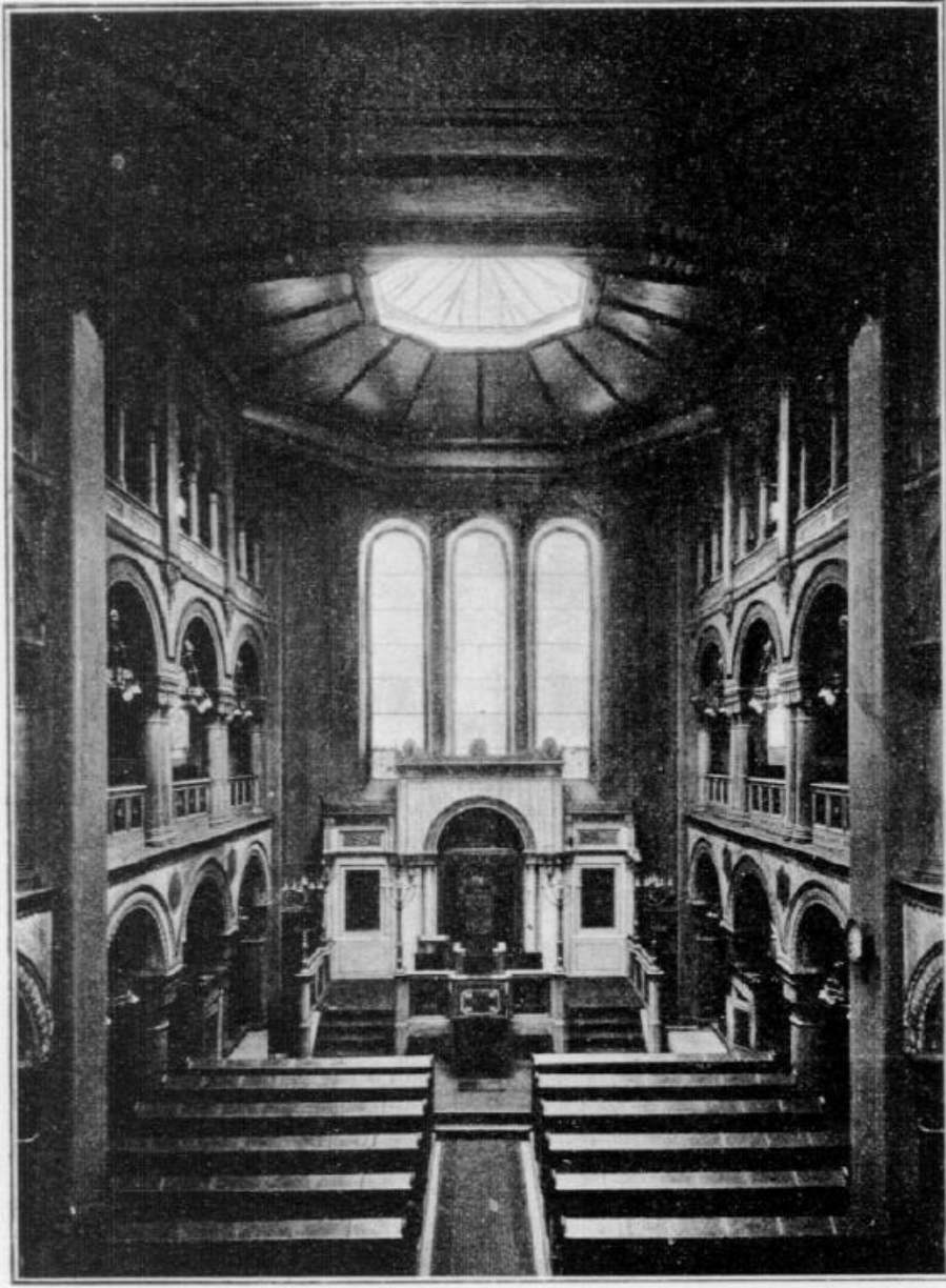
Das Innere der Hauptsynagoge zu Mainz.